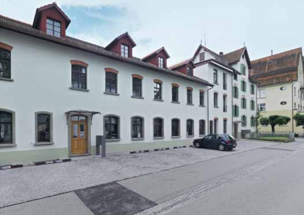
Renoviert: Pilatusstrasse (links) und Wohnhaus Erlenstrasse (unten).