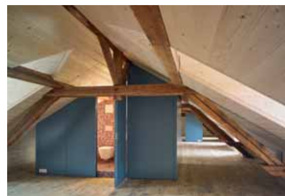
Dachgeschoss mit Bad.

Bei dieser Sanierung wurden gemeinsam wichtige Entscheide zur Farb- und Materialwahl als Grobraster auf Papier dokumentiert (Pläne, Malproben usw.) und auf dem Bau anhand von 1:1-Mustern verfeinert. Für das planende und ausführende Architekturbüro war der ra-